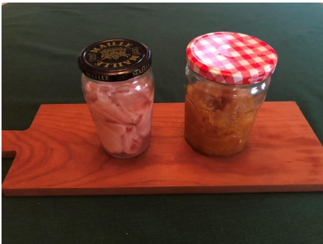
新生姜の甘酢漬け マーマレード