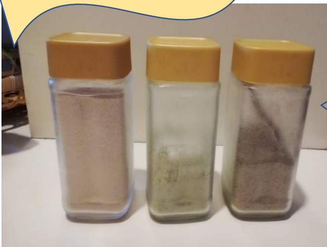
ドライイースト、昆布パウダー、いりこ粉末